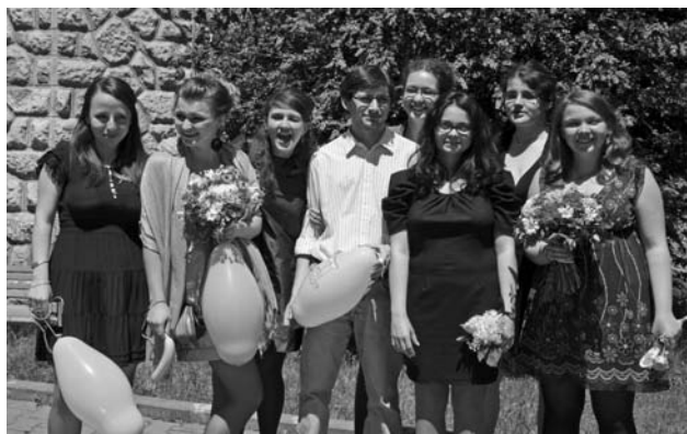
Egyel többben, mint a gonoszok – idén végzett teatrológiások Kolozsvárról

Fő tevékenységem a Váróterem Projekt Egyesület, amit hárman hoztunk létre, de most már nagyon sokan, kilencen vagyunk ben-