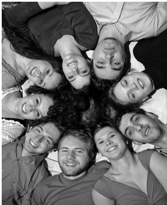
A teatrológusok persze hogy nem fértek rá a képre – idén végzett színészek Vásárhelyről

Az újvidéki Művészeti Akadémián kétévente indul színészképzés. Vajdaságban három állandó társulattal rendelkező magyar színház van: a Szabadkai Népszínház, a Kosztolányi Dezső Színház és az Újvidéki Színház. A színházak próbálnak gondoskodni a színészekről, ez azonban szabad állások híján sok esetben csak produkcióra-szerződötteséssel oldható meg. A 2010-ben végzett hét fős évfolyamból négynek sikerült ideiglenes állást találni színháznál, hárman szabad-