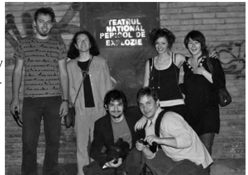
Háttérfelirat: „Nemzeti Színház. Robbanásveszély.” No comment – idén végzett rendezőisek Vásárhelyről