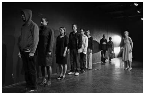
Cukrot és olajat osztanak – idén végzett színészek Kolozsvárról