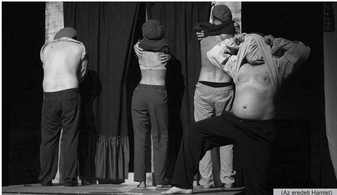
(Az eredeti Hamlet)

XIV. évfolyam 4. szám – 2013. június 25., kedd